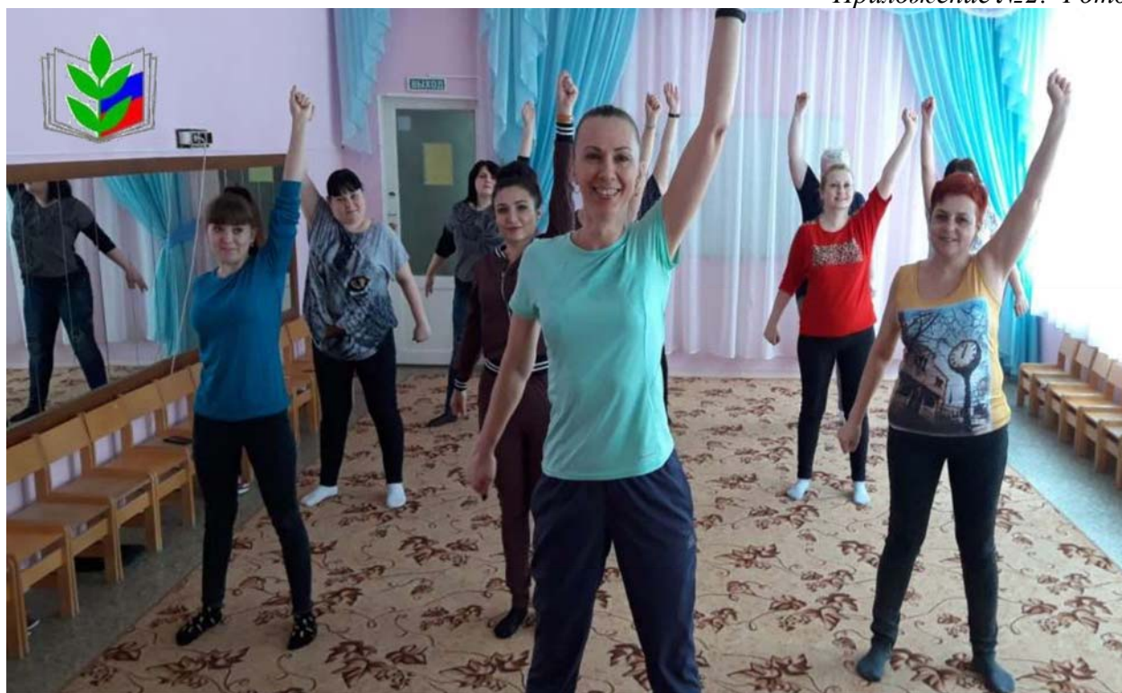
Ежедневная производственная гимнастика и море позитива!